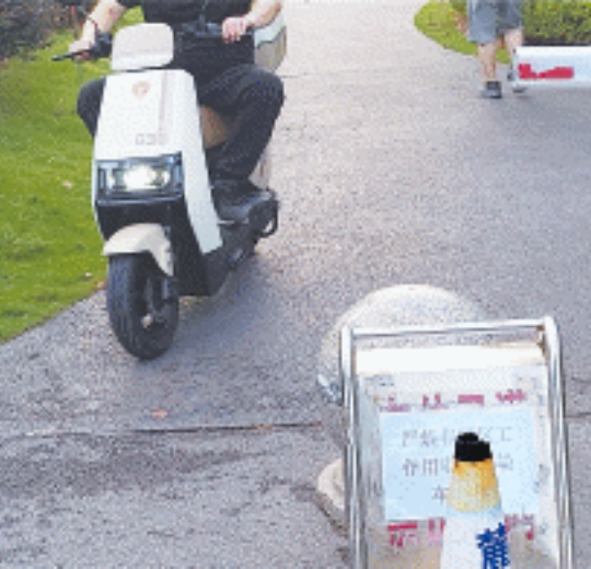
在公园门口随意穿行进出的电动车。

“公园这么大,很难管住那么多车。”湘府文化公园的保安叹着气说,“大大小小的入口那么多,有时候一不留神,电动车、摩托车就进来了,我们只能尽力劝阻。”