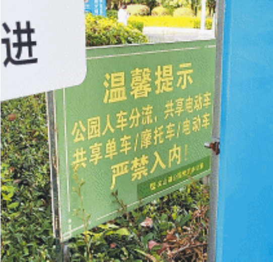
公园告示牌明确提示摩托车电动车等严禁入内。