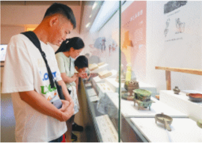
甘肃魏晋画像砖特展于7月26日免费对游客开放。

长沙晚报7月25日讯(全媒体记者 任波 通讯员 万国珍 刘雨涵)7月26日,一场对暑期青少年极具吸引力的甘肃魏晋画像砖专题展——“西北风来 塞柳长青”特展将在长沙博物馆重磅启幕。25日本报记者率先进入长博二楼特展二厅探馆该展。本次展览集结甘肃多家文博机构珍藏的164件套文物,其中65件画像砖首度在湘集中亮相,这些承载着1700年前甘肃河西走廊烟火气的文物,从出行宴饮到耕织安居,以微观视角还原魏晋社会风貌,更通过左宗棠治疆史迹的穿插,串联起古今对“安居乐业”的永恒追求。