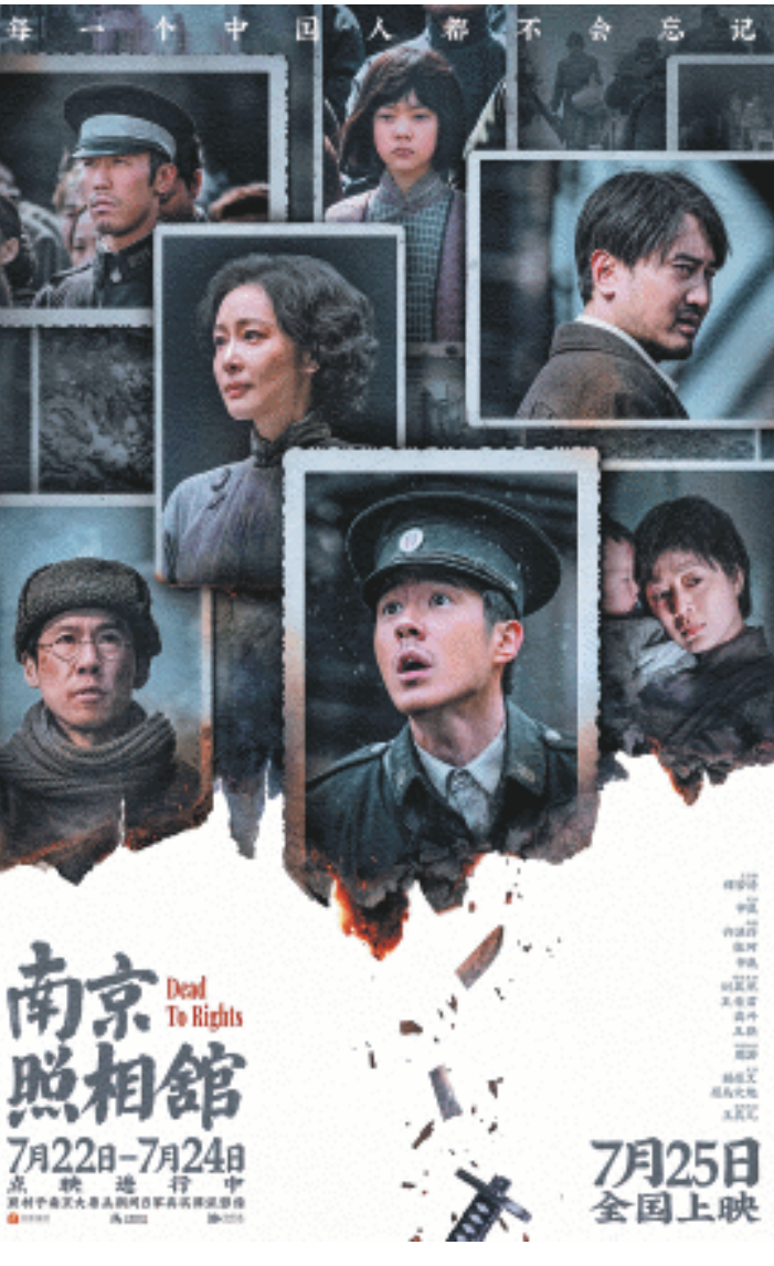
《南京照相馆》海报 均为资料图片

暑期档电影百花齐放，在《南京照相馆》的带动下，《长安的荔枝》《戏台》等真人电影的预测票房也在提高。目前，《长安的荔枝》上映18天，票房已突破6.3亿元。