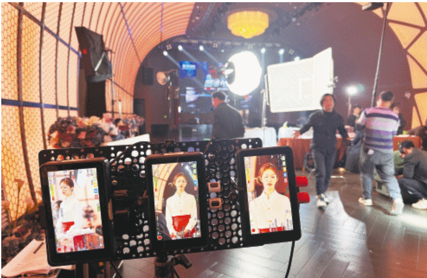
湖南后窗影视传媒有限公司团队在拍摄短剧。