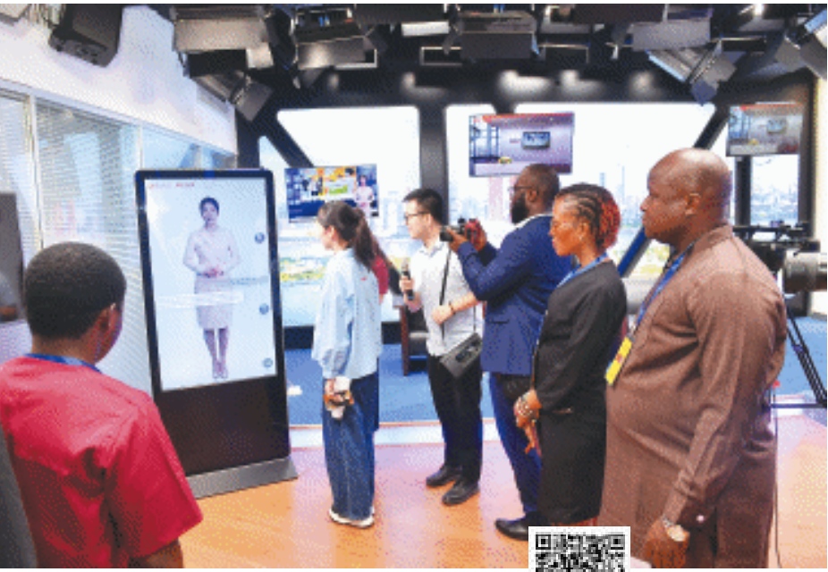
利比里亚媒体人与本报“数智记者”互动。

谈到未来的合作,利比里亚的媒体同仁表示十分期待,迫不及待想报道有关中国媒体技术实践、中国传统文化等选题。“希望未来,我们能分享更多各自国家的文化和风土