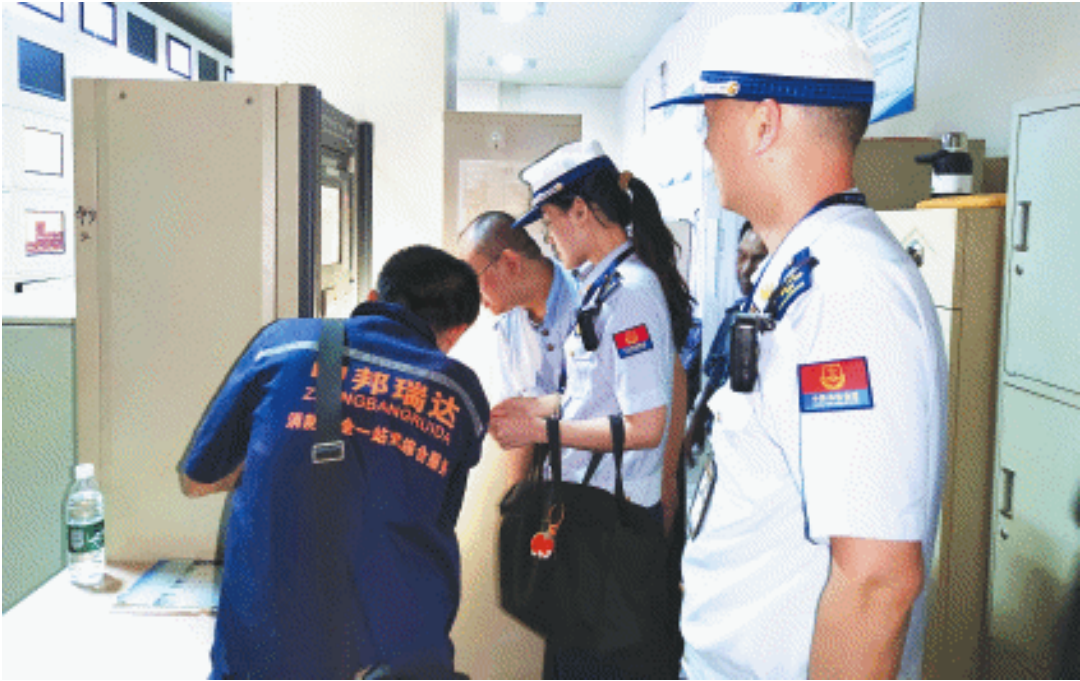
图为消防人员正在夜查。

此次行动结合“双随机”任务，针对大型商业综合体、酒店宾馆、公共娱乐场所等夜间经营、住宿场所，重点检查消防安全主体责任落实、消防控制室人员持证在岗、消防通道畅通、消防设施完好有效、防火巡查及用火用电用气规范等情况，考查了现场人员消防知识与应急技能。针对发现的问题，消防监督员现场提出整改意见，能立即整改的当场整改，需限期整改的登记建档、实行闭环管理并跟踪指导。同时叮嘱单位负责人树牢安全思维，落实主体责任，加强防范措施。下一步，长沙消防将加大巡查力度，开展消防安全培训，保障全市火灾形势稳定。