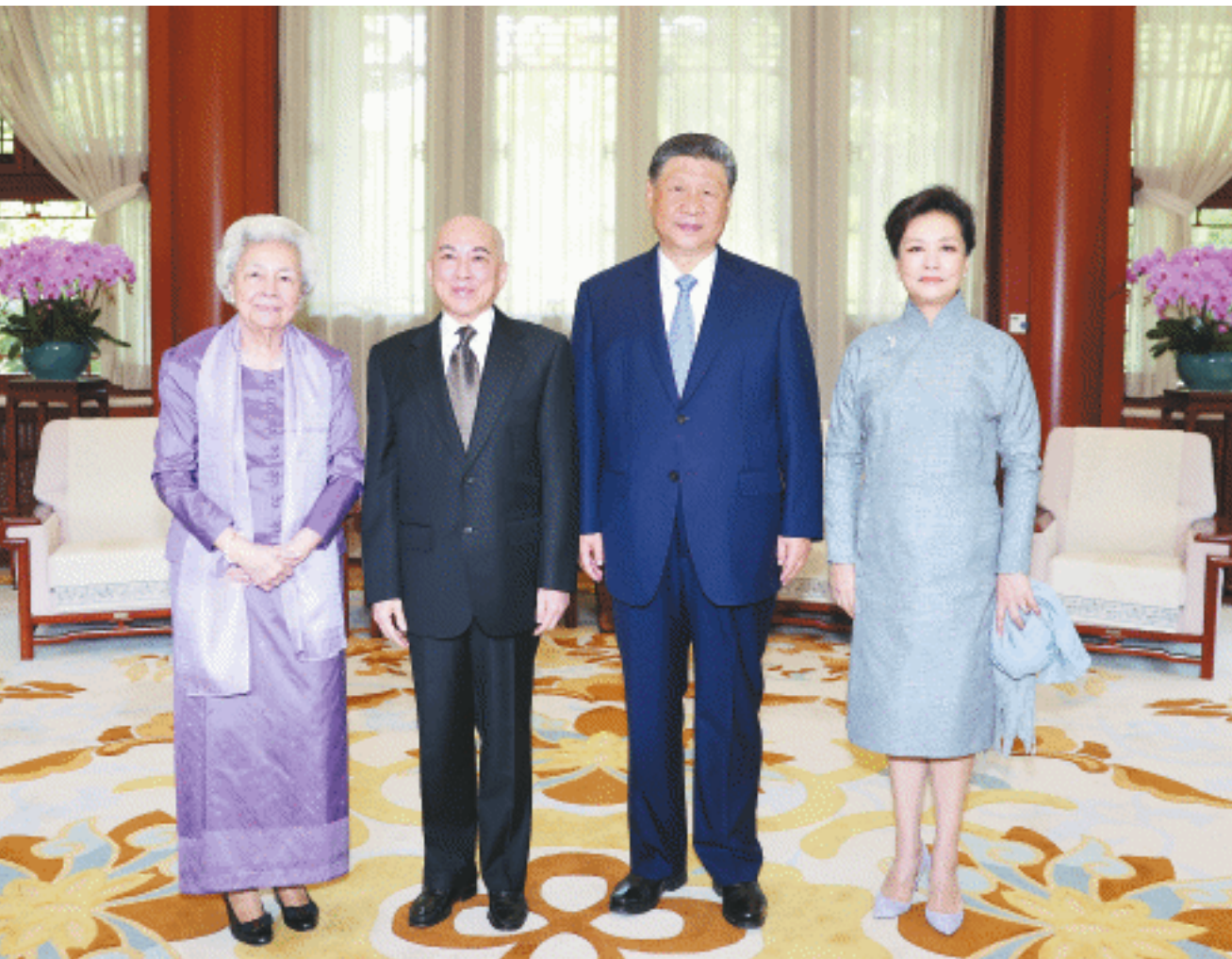
8月26日上午，国家主席习近平和夫人彭丽媛在北京中南海亲切会见柬埔寨国王西哈莫尼和太后莫尼列。

新华社北京8月26日电 8月26日上午，国家主席习近平和夫人彭丽媛在中南海亲切会见柬埔寨国王西哈莫尼和太后莫尼列。 习近平热烈欢迎西哈莫尼国王和莫尼列太后再次来华，也欢迎西哈莫尼国王出席中国人民抗日战争暨世界反法西斯战争胜利80周年纪念活动。习近平表示，今年4月我对柬埔寨进行国事访问，受到国王陛下和柬埔寨人民热情友好接待，至今想起都感到十分亲切。中柬关系历经国际风云考验，结成风雨同舟的铁杆友谊，成为两国人民的宝贵财富，值得双方倍加珍惜。面对变乱交织的国际形势，中柬两国要更加坚定地站在一起，赓续传统友谊，加强团结协作，加快建设新时代全天候中柬命运共同体，为两国人民带来更多福祉。中方坚定支持柬埔寨人民走符合本国国情的发展道路，实现国家长治久安。 西哈莫尼和莫尼列表示，很高兴再次来华并应邀出席中国人民抗日战争暨世界反法西斯战争胜利80周年纪念活动，中国人民为维护世界和平作出重大贡献，值得永远铭记。习近平主席4月对柬埔寨进行历史性国事访问，双方畅叙友谊、共商合作，取得重要成果。柬方始终从战略高度看待柬中关系，愿将柬中传统友好关系发扬光大，共同构建新时代全天候柬中命运共同体。 王毅参加会见。