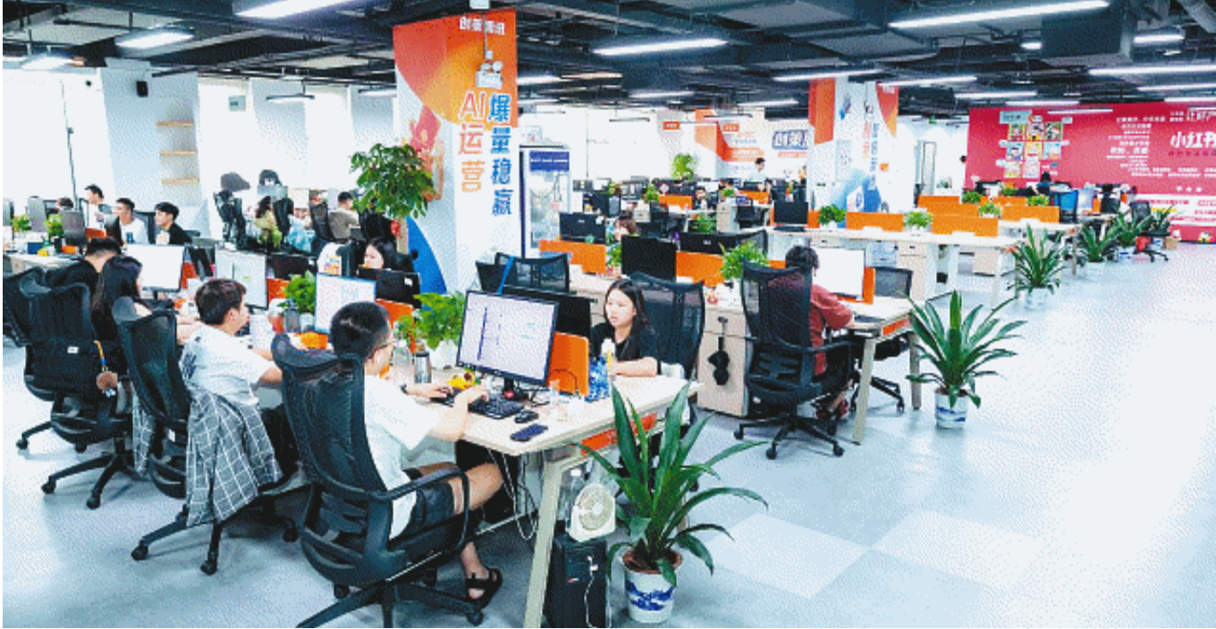
走进创研股份办公区,员工们各司其职,用AI帮中小企业把营销做得又准、又省、又快。

近日,记者走访了创研股份,看这家以“AI+效果营销”为核心的企业,如何用前沿的技术手段,重新定义互联网营销的效能标准。