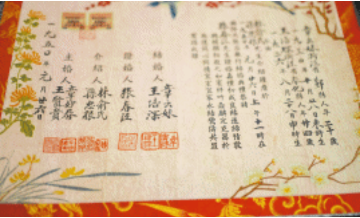
↑ 这张1950年的结婚请柬印制精美,显得格外浪漫温馨。

游客的需求在哪里,长沙的服务就在哪里。从一张便条、一块指路牌到一套完整的服务体系,长沙用细节证明,有一种暖心叫长沙。