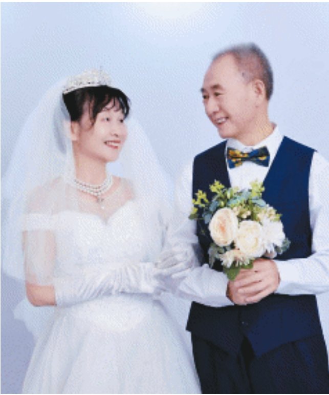
—对银发老人穿上婚纱礼服,脸上洋溢出幸福的笑容。