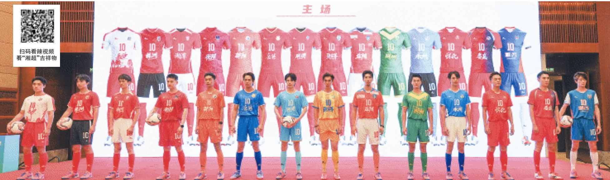
各市州“湘超”队服发布展示。

长沙晚报9月1日讯(全媒体记者 赵紫名)9月1日,2025湖南省足球联赛(以下简称“湘超联赛”)媒体见面会将在长沙举行。会上发布了湘超联赛首轮对阵、赛事Logo、主题口号、吉祥物及各队球衣等信息。在傍晚6时,揭幕战长沙队对阵娄底队的比赛门票正式开售,9.9元一张的门票仅用时5分钟就售罄。