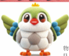
吉祥物“湘湘”。

目前,各队报名工作已经结束并完成初步审核,以本市州学籍报名的中学生和大学生占运动员总人数比例约为58%,教练员共计84人,其中职业级2人,A级教练员6人、B级教练员7人。