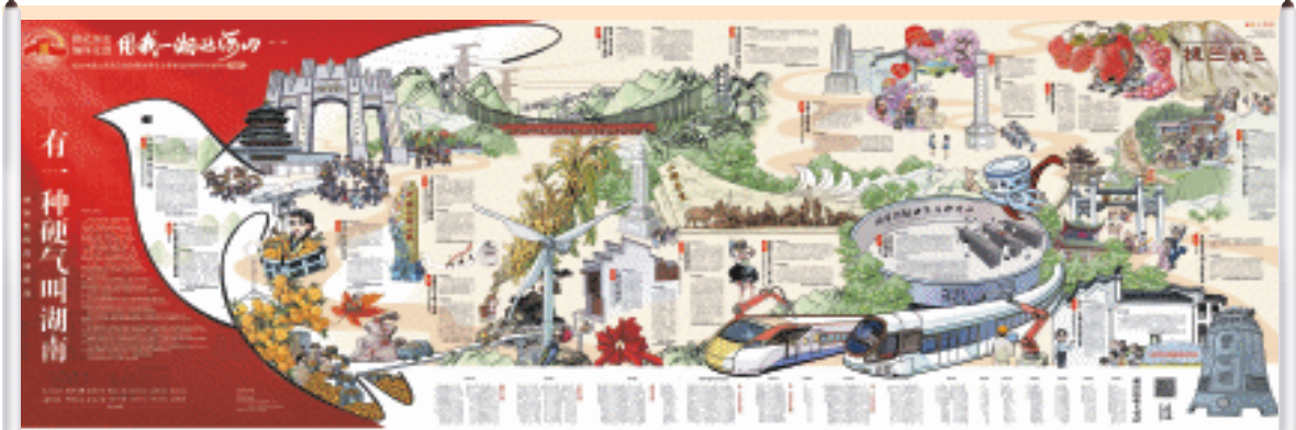
湖南14市州党报今日联动推出 大型手绘四连版《地标里的湖湘抗战》

长沙晚报9月2日讯(全媒体记者 贺黎黎)湖南是中国抗战的重要战场与钢铁屏障，六次大会战震惊中外。在纪念中国人民抗日战争暨世界反法西斯战争胜利80周年的庄严时刻，一幅跨越时空的湖湘抗战画卷磅礴展开——9月3日，长沙晚报携手省内其他13个市州党报共同推出大型手绘四连版《地标里的湖湘抗战》，以深沉的历史情