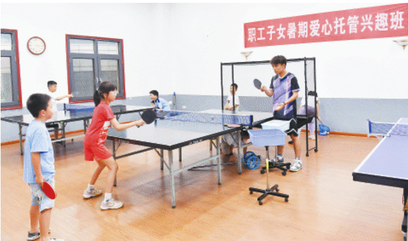
长沙晚报社(集团公司)暑期托管涵盖乒乓球、书法等兴趣拓展内容,深受孩子们欢迎。

眼下,“生育友好型社会”成为社会关注的热点话题。从发放育儿补贴到逐步推行免费学前教育,今年以来,国家连放“大招”,用真金白银支持建设生育友好型社会。 日前,国家卫健委等单位联合下发《关于加快推进普惠托育服务体系建设的意见》,明确“推动用人单位办托”。其中,“机关、事业单位和国有企业要发挥带头作用,结合实际为本单位职工提供普惠托育服务。” 解决“育”的难题,减轻“养”的负担,才能进一步激发“生”的意愿。近年来,长沙国有企业持续探索,纾解职工家庭“带娃焦虑”,切实保障职工生育权益等,积极参与推动生育友好型社会建设。 从“看住娃”走向“看好娃” 刚刚过去的暑假,长沙晚报大楼职工活动中心被孩子们的欢声笑语包围。 今年是长沙晚报社(集团公司)开设职工子女暑期爱心托管兴趣班的第三个年头。通过前期广泛征求意见,今年的托管服务围绕乒乓球、书法等兴趣拓展内容,邀请来自湖南省书法家协会、天心区乒乓球协会的资深老师、专业教练授课,深受孩子们欢迎。此外,长沙晚报工会还联手知识博览馆,首次开办了“迷彩少年”军事夏令营,从“看住娃”到“看好娃”,多途径缓解暑期“看护难”,收获职工一致好评。 修订完善慰问政策、提质升级“职工之家”、设立母婴室……近年来,长沙晚报还通过政策推动、集体协商、服务保障等举措,持续完善职工生育福利制度,确保产假、哺乳假、陪产假等法定权益全覆盖,切实维护职工,特别是女性职工生育期间合法权益,为职工平衡家庭与职场提供有力支撑。 企业普惠托管,暖心更安心 走进位于湘江集团10楼的职工子女爱心托管班,场地宽敞明亮,空调、饮水机、休息区等设施一应俱全。今年暑假,湘江集团100余名 员子女在这里度过了平安快乐的假期。 “能不能再加办一期?”“小朋友特别开心,都合不得结业”……托管班微信群里,职工的点赞留言持续刷屏。记者了解到,湘江集团托管班课程不仅设置有作业辅导、阅读写作、数学思维等学习活动,以及篮球、足球、羽毛球等运动体验课,还联合专业机构提供美术、舞蹈、英语口语等自费特色课程。 “开设托管班有效解决了职工子女看护难题,帮助孩子们全面发展,也进一步增强了职工对企业的归属感和认同感。”湘江集团工会相关负责人说。 长房集团则依托“国企主导+专业运营”模式,整合旗下商圈优质资源,改造逾800平方米多功能空间,联合专业机构开展科技探索、文化传承、运动实践、实地研学等课程,构筑优质成长空间,搭建多元成长平台,助力长沙打造