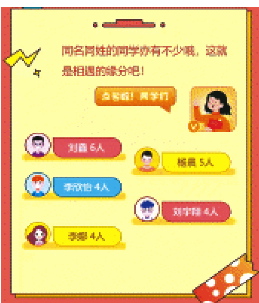
湖南农业大学新生同名同姓大家庭。

日前,湖南多所高校陆续发布了自家2025级新生大数据,数字背后,不只是冷冰冰的统计,更是一幅五彩斑斓的青春画卷:有人天南北相聚一堂,有人因同名同姓不得不“自带编号”,还有人和学校“撞生日”,冥冥之中自带缘分。让我们一起来看看,今年的湖南高校新生到底藏着多少有趣的故事吧! 男女比例 工科“热血男团”,文艺“巾帼扎堆” 性别分布永远是新生最关心的“话题榜”。 在湖南工商大学,新生男女比例约为1:1.17,看似均衡,却在学院和专业上“分道扬镳”:计算机学院是男生主场,而数字媒体工程与人文学院则是女生天下。再细分,新工科+新医科是男生略多,新商科和新文科却是女生压倒性优势。 长沙学院的情况更为鲜明:舞蹈学专业女生比例高达92.11%,而机器人工程专业的男生比例则有96.43%,堪称“单性别专业”。 湖南第一师范学院“萌新”整体男女比约为2:3,而长沙师范学院则“女生碾压”,男女比例1:2.12。看来,文科、师范类依旧是姑娘们的热土,而工程、机械依旧是男生的“根据地”。 年龄差异 相差32岁,堪称“跨越时空的同窗” 青春的年纪并不只有“标准版”,新生的年