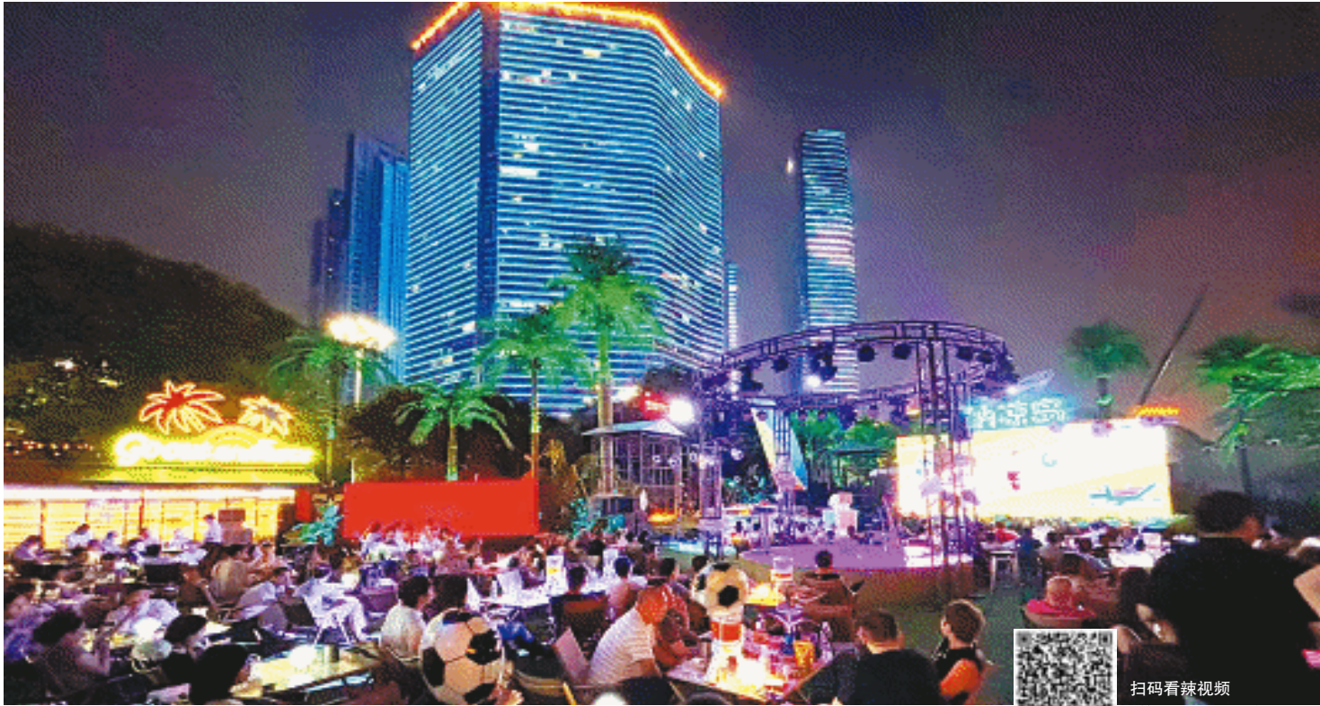
湘江畔的野肆月球打造出独特的露天观赛空间。

从江畔回到古城一隅,天心阁下的观赛场景则演绎了古今交融的独特韵味。古城墙旁的巨幕