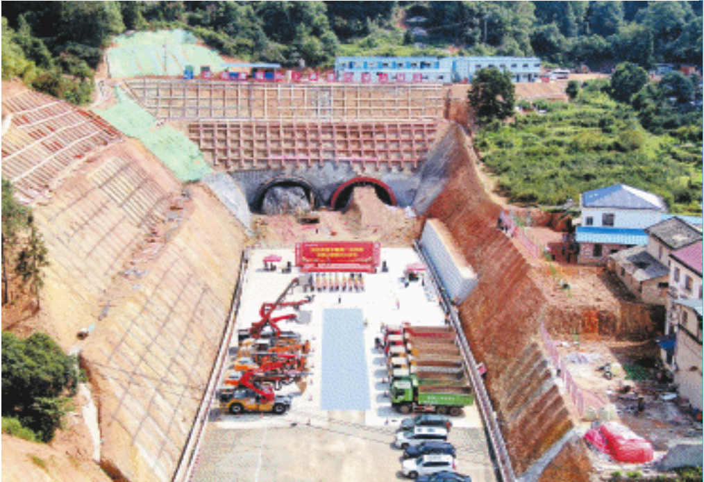
9月8日,浏江高速西湖山隧道进口端顺利动工。

浏江高速(浏阳—江背)是湖南省高速公路网“七纵九横”中第四横长永段的扩容线,也是浏阳“四个十大”基础设施项目之一,途经浏阳淮川、集里、葛家、镇头等多个乡镇(街道),全长26.78公里,共设5个施工标段,另设西湖山、太平桥2条连接线。项目整体完工后,将成为浏阳继长浏高速之后,连接省会长沙的又一条高速通道,对进一步联通长沙南部城区、优化浏阳区域路网,促进湘赣边区域合作示范区建设,带动区域商贸物流、文化旅游发展具有重要意义。