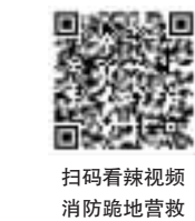
扫码看辣视频 消防跪地营救