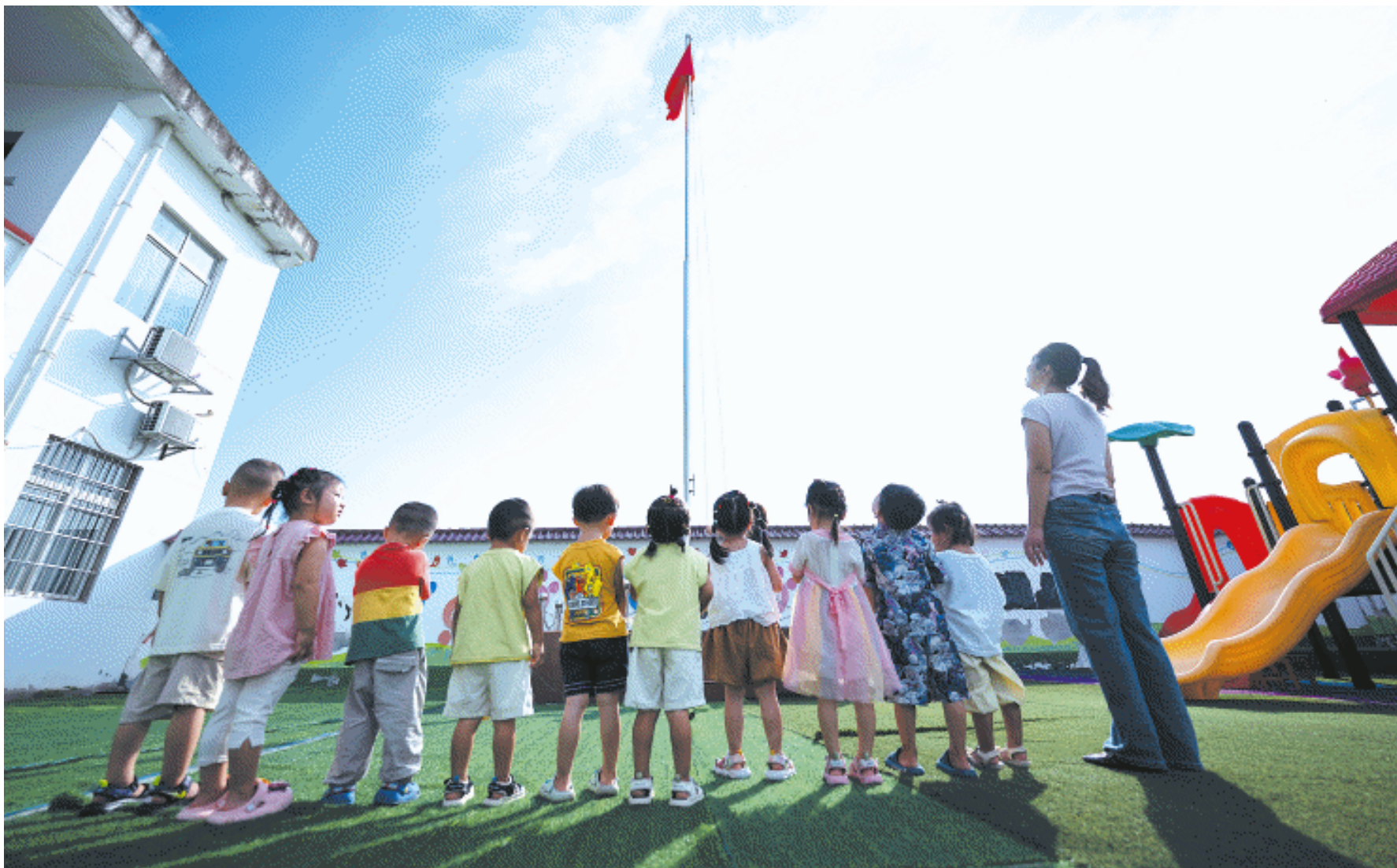
早上，幼儿园举行升旗仪式，孩子们站在旗杆下注视着国旗。