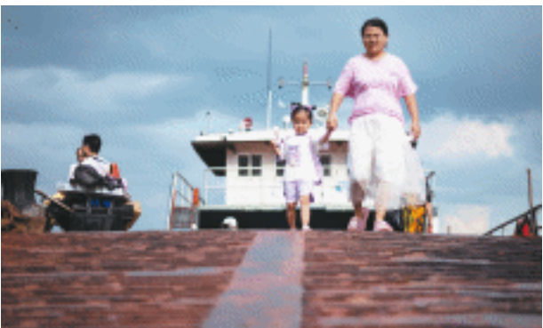
一位妈妈带着孩子走下轮渡。