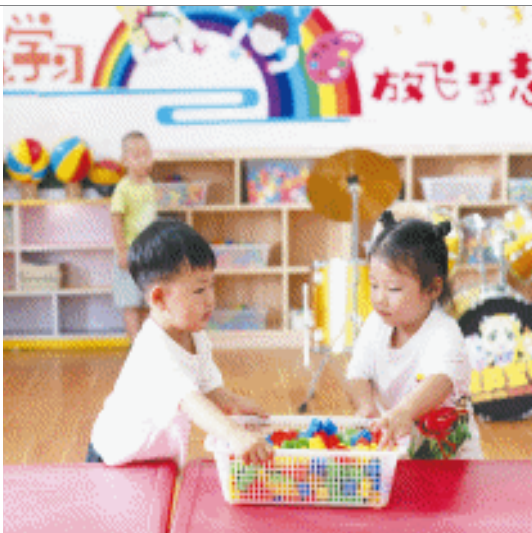
幼儿园给孩子们准备了不少玩具，两个孩子准备玩积木。