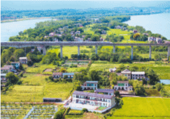
兴马洲中央，一列高铁从幼儿园后方高架飞驰而过。