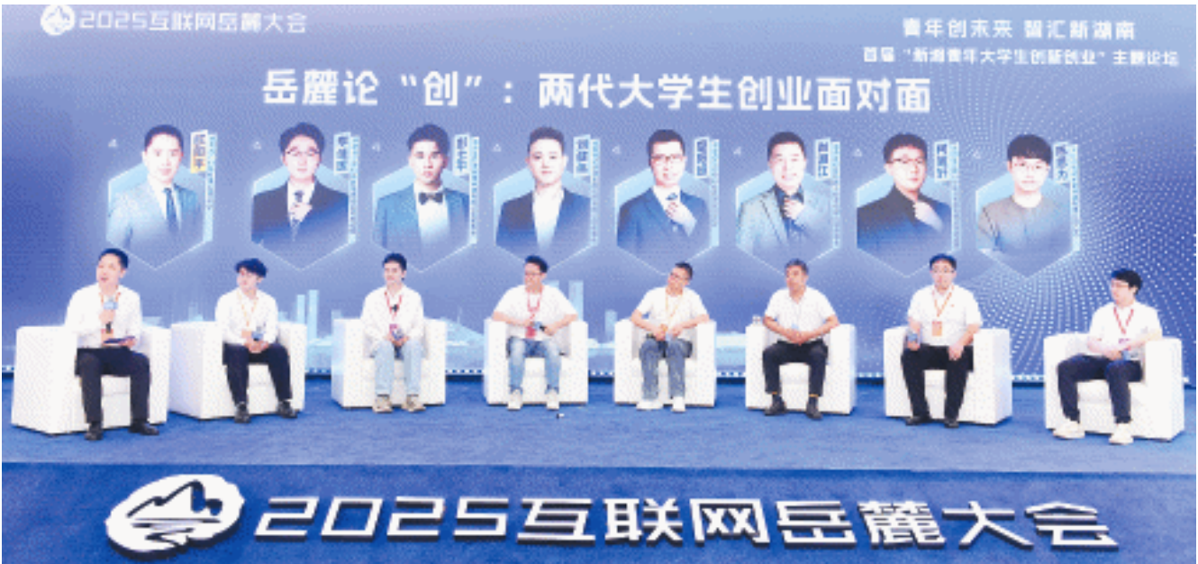
圆桌论坛《岳麓论“创”：两代大学生创业面对面》现场。

到2026年，长沙计划实现万辆C-V2X终端网联服务，培育550家以上集群企业。