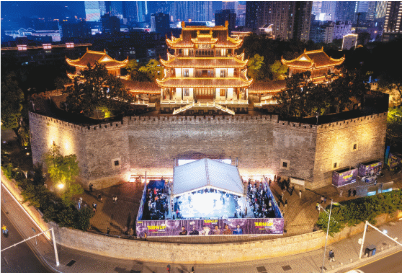
9月20日，王府井集团2025 TURN UP亚洲街舞大赛全国巡回总决赛于长沙天心阁火热开启。