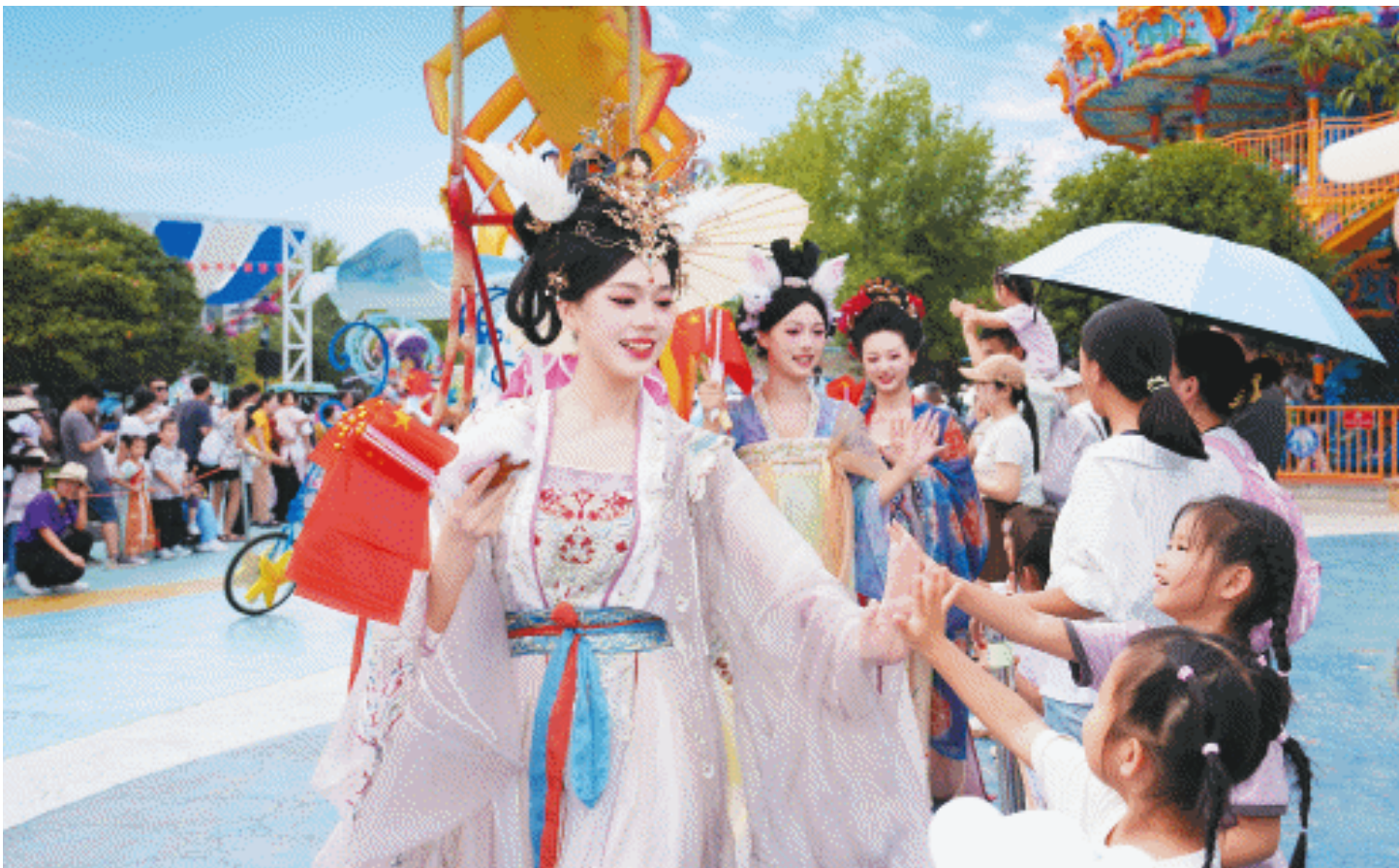
这个长假，长沙文旅市场火热、消费旺盛。图为湘江欢乐海洋公园里，身穿国风服装的演员们与游客互动。