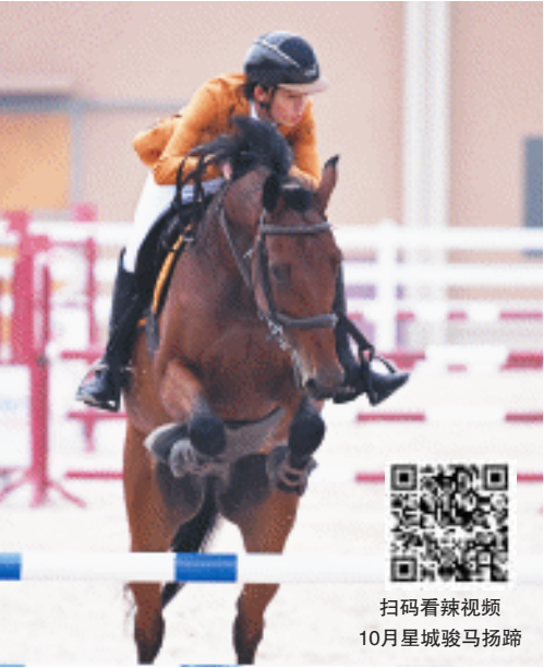
10月12日上午，市运会马术比赛（青、少年组）举行。

10月12日晚，株洲市体育中心，株洲队以3比0的比分战胜怀化队。