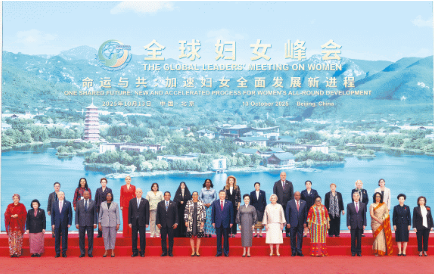
10月13日上午，国家主席习近平在北京国家会议中心出席全球妇女峰会开幕式并发表主旨讲话。这是习近平和夫人彭丽媛同与会各国和国际组织代表团团长夫妇合影留念。