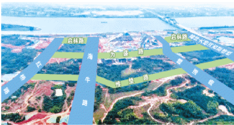
湘江科学城首开区“三纵四横”路网示意图 制图/何朝霞

除“三纵四横”路网外，湘江科学城内的各个项目正在加速“成长”。记者了解到，该片区标志性项目湘江科学中心正在推进装修施工，计划2026年整体建成投用；湖南大学科创港二标段完成主体结构封顶，计划2026年9月投入运营；白庭路、科创大道（原白云城际主干道）两条融城主干道基本完成建设；中央绿轴公园、湘江科学城湿地公园、能源站等配套项目陆续启动建设；湖南钢铁技术研究院、湖南师范学科科创港、本源新材料研究院、湘江科学城新材料基地等重大项目纷纷入驻，将大力推动人才集聚和科技产业发展。