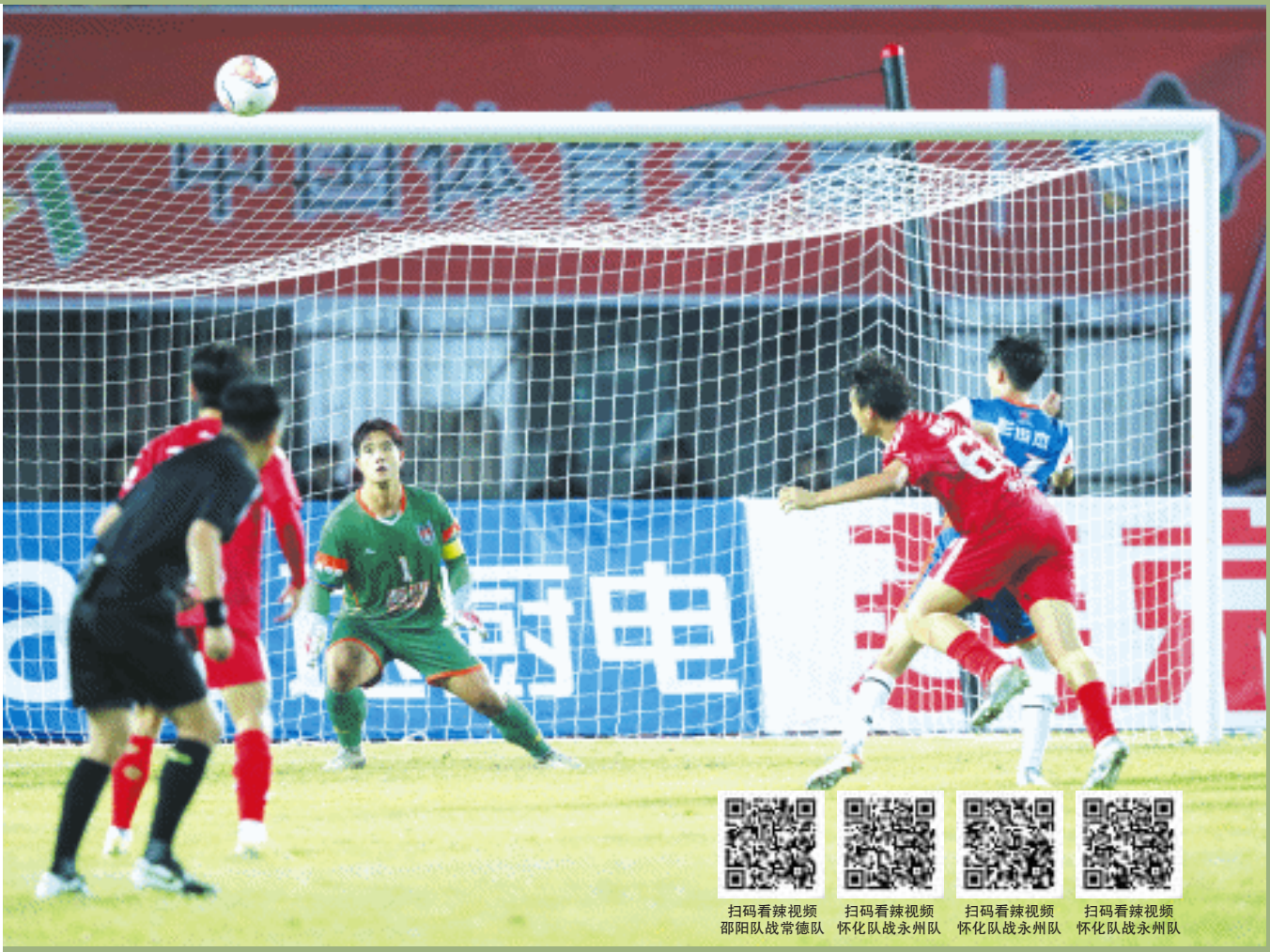
10月18日晚，“湘超”联赛第六轮，衡阳队在主场6比2大胜湘西队。