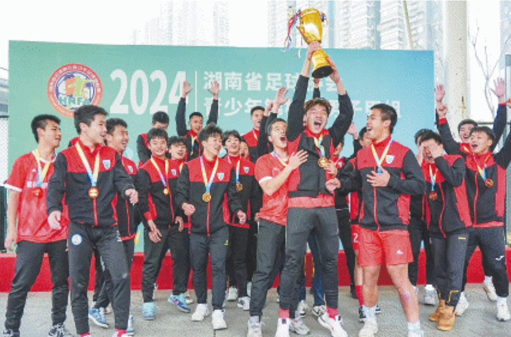
2024年初,同升湖高级中学足球队在2024湖南省足球协会青少年锦标赛男子甲组比赛中荣获冠军。