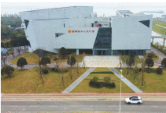
望城区工人文化宫年内将基本具备运营条件。

项目正式投运后,将进一步完善大泽湖片区的公共服务设施配套体系,丰富市民的精神文化生活,提升望城区公共服务水平。