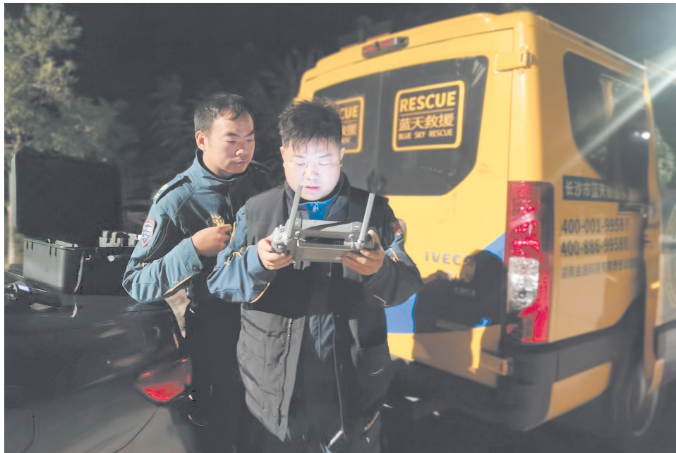
队员用无人机搜寻受困者。长沙晚报通讯员 曾劲玉 供图

据了解，这位驴友当天上午独自进入黑麋峰森林公园徒步，原本跟随导航行走，却在溪谷中迷失了方向。“我那时已经能看到山下的大路了，可眼前是悬崖，根本无路可走。”回忆当时的情景，刘先生仍心有余悸。救援刻不容缓。队员肖玉成第一时间载着2台无人机、1台移动电源和大量通信照明