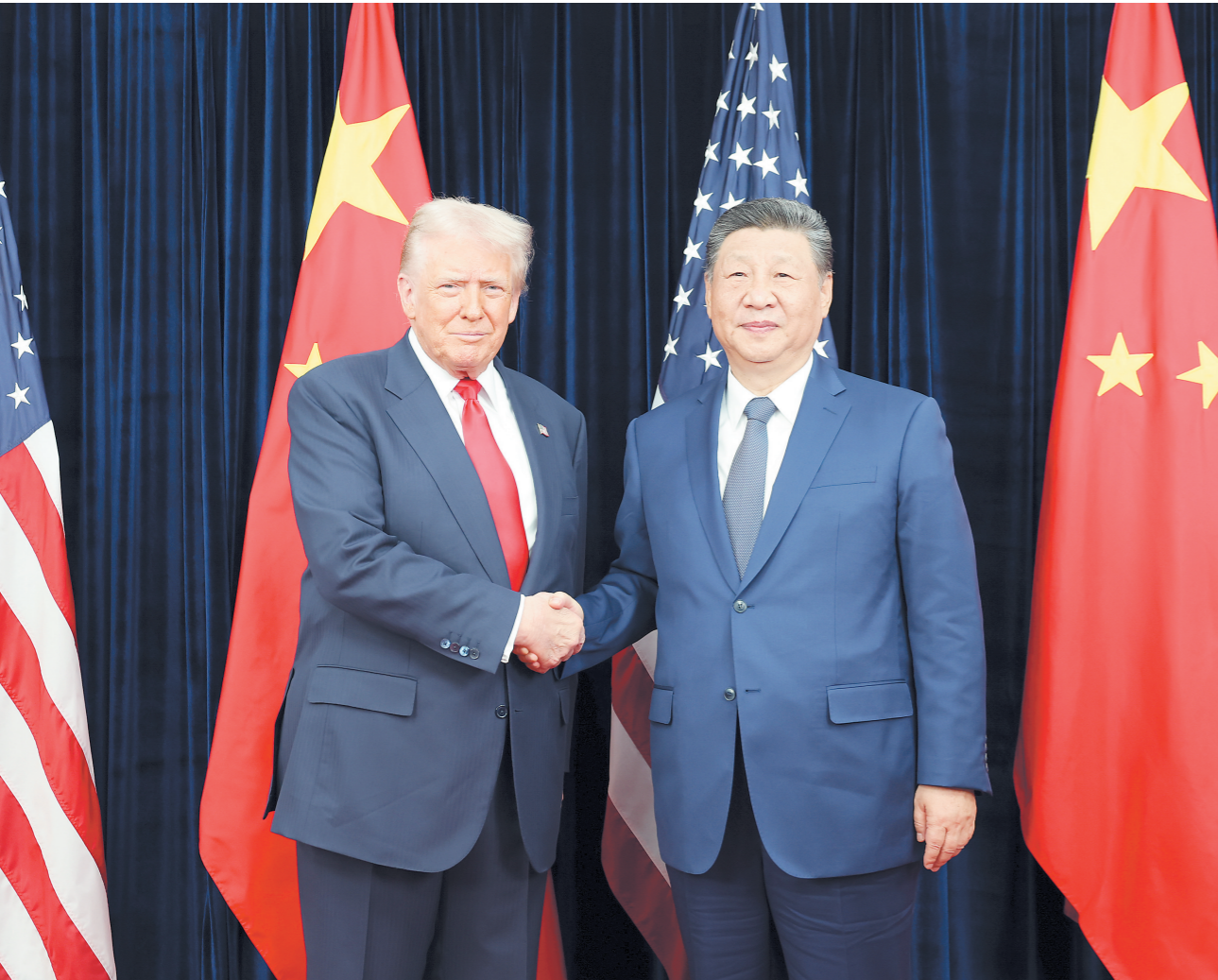
当地时间10月30日，国家主席习近平在釜山同美国总统特朗普举行会晤。

新华社韩国釜山10月30日电(记者李忠发 郝薇薇)当地时间10月30日，国家主席习近平在釜山同美国总统特朗普举行会晤。 习近平指出，中美关系在我们共同引领下，保持总体稳定。两国做伙伴、做朋友，这是历史的启示，也是现实的需要。两国国情不同，难免会有一些分歧，作为世界前两大经济体，时而有摩擦，这很正常。面对风浪和挑战，两国元首作为舵手，应当把握好方向、驾驭住大局，让中美关系这艘大船平稳前行。我愿继续同特朗普总统一道，为中美关系打下一个稳固的基础，也为两国各自发展营造良好的环境。 习近平强调，中国经济发展势头不