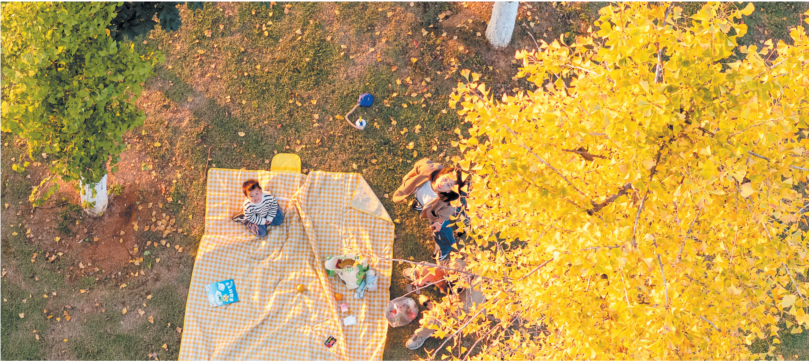
📍 西湖公园 ↑一位小朋友正在银杏树下玩耍。