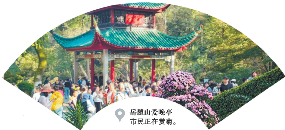
📍 岳麓山爱晚亭 市民正在赏菊。

连日来，长沙秋意渐浓，金黄、橙红、翠绿交织成斑斓调色盘。农大旁的枫叶飞舞，烈士陵园水杉映湖，大泽湖湿地野趣，开福大道彩林绵延，西湖公园湖光鹭影……秋日美景次第绽放，让星城长沙成为赏秋胜地。 本报记者用一组组摄影图片定格下了这份独有的城市秋韵，带市民沉浸式感受『星城秋景』。