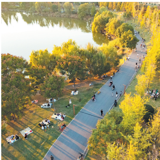
📍 西湖公园 湖边银杏叶黄了，水杉树红了。