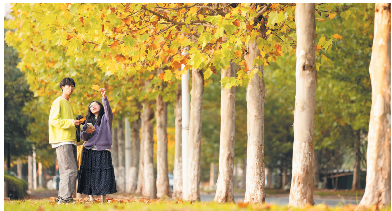
📍 滨河路 道路两旁的梧桐已开始变得色彩丰富，两位市民正在树下打卡拍照。

从校园到名山，从公园到湿地，长沙的秋景藏在城市的每一处肌理中。这些秋日盛景，不仅是市民休闲赏景的好去处，更彰显着城市生态环境保护和园林绿化建设的丰硕成果。市民不妨趁着冬日短暂的晴好天气，走进这些秋日秘境，亲身感受长沙的秋之美。