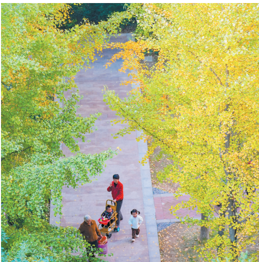
📍 望城一小区 银杏变黄，给小区增添一抹亮色。