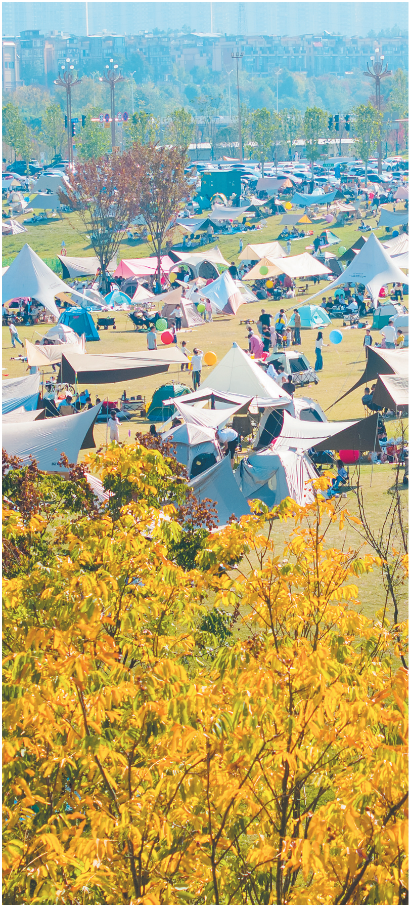
📍 大泽湖近自然湿地公园 →11月16日，长沙秋高气爽，市民纷纷到户外“捕捉”秋色。