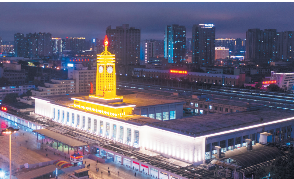
长沙火车站主塔楼顶上的火炬造型鲜艳夺目。