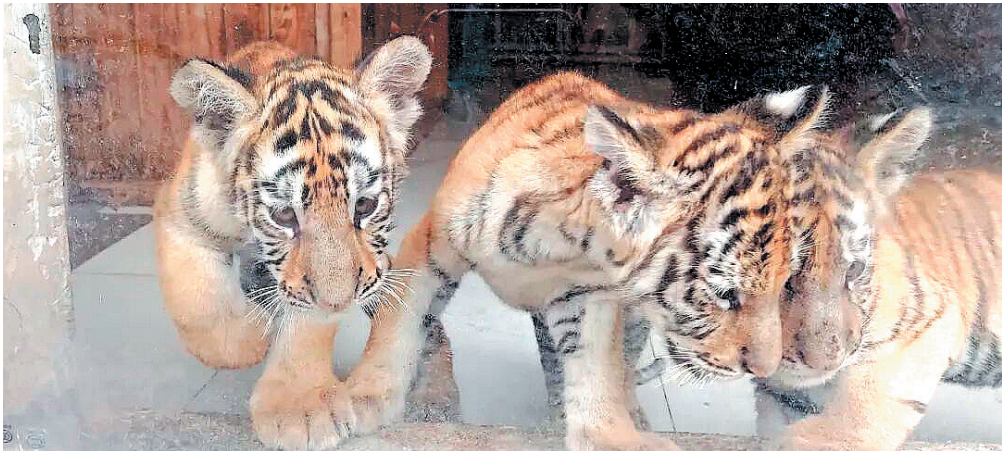
三只小老虎躺在保育员的脚边舒心地晒着太阳。