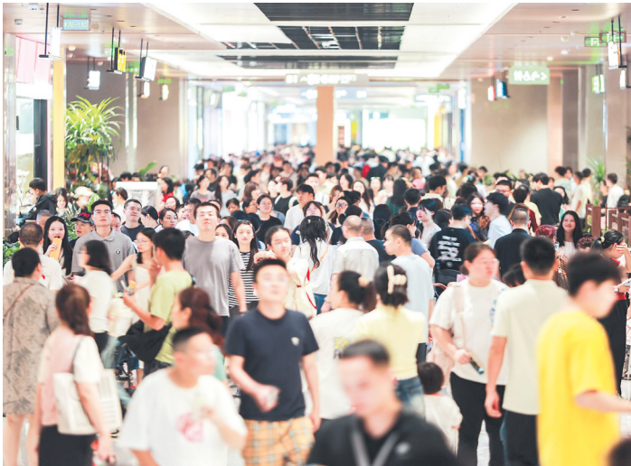
万象城国庆长假首日客流突破20万人次。