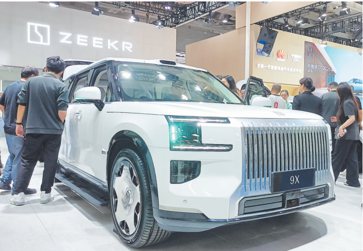
刚刚上市的新车引起消费者围观。

系列举措持续带火消费,1至10月全市社零总额4775.98亿元,同比增长5.1%