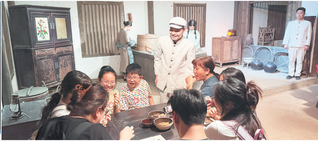
观众穿梭于分剧场与主剧场之间,“一不小心”就成了戏中人。

长沙晚报全媒体记者 尹玮 “来来来,你来看。你看这个男的,长得是一表人才的,你为什么就吸了他呀?”“啊,他跟我提分手。”“你为什么要跟她提分手?” 坡子街湘江剧场里,沉浸新中式湘剧《聂小倩》的演员走下台来,随手抓过一位男观众,抛出“灵魂拷问”。被“抓包”的幸运儿涨红了脸支吾半天,台下早已笑成一片。演员捂着嘴乐:“这位置的观众总爱装深沉,今天可算被我问住了,活该!” 这样台上台下“打成一片”的热闹,如今在长沙的小剧场里已成常态。坡子街的湘剧、橘子洲的红色演艺、五一广场的脱口秀,场场爆满的演出背后,是星城演艺市场的蓬勃活力。11月21日,中共长沙市委宣传部、长沙市文化旅游广电局印发《长沙市推进演艺新空间(小剧场)建设三年行动计划(2025-2027)》的通知。这份“真金白银”的政策红利,正让“演艺名城”成为长沙继“媒体艺术之都”后,又一张闪亮的文化名片。