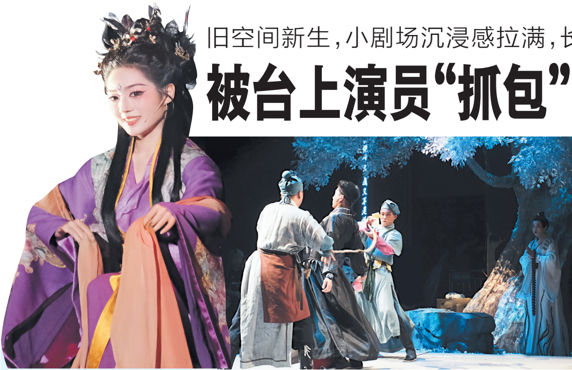
新中式湘剧《聂小倩》开启了湖南湘剧本土沉浸式驻场演出的新篇章。