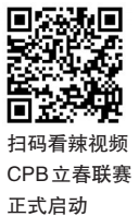
扫码看辣视频 CPB立春联赛正式启动

在全球很多国家,棒球联赛都是很有影响力的商业体育联盟,CPB中国棒球城市联赛开启之后,也将加快商业化、职业化进程,提升体育消费潜力。据悉,联赛计划先期以三年发展规划稳健推进。2026赛季进行赛会制的立春联赛和夏至联赛;2027年保留立春联赛,将夏至联赛升级为俱乐部巡回主场制,2028年联赛走向全面主客场制的联赛体系,保留立春联赛作为常规赛季的前热身赛。