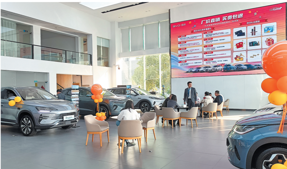
12月1日下午,中创比亚迪4S店里有不少客户在与销售顾问洽谈,准备“跑步”购车。

记者发现,车企一般将这种补贴购置税的形式称为“兜底方案”,补贴范围则涵盖车企旗下全部或部分车型,最高额度1.5万元。