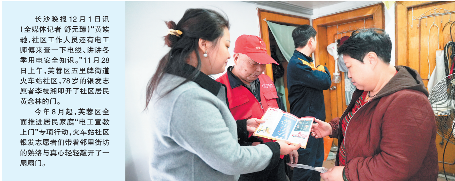
芙蓉区“电工宣教上门”行动将持续到明年三四月份。

芙蓉区“电工宣教上门”行动已完成3万多户家庭、180余家楼宇企业的电路隐患排查与安全宣教工作