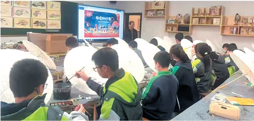
孩子们在油纸伞伞面上画出了“天青色等烟雨”的感觉。