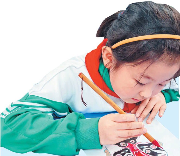
正在聚精会神地学画戏曲脸谱的孩子。校园少年的戏曲热情让非遗的薪火不灭,并悄然扎根发芽。