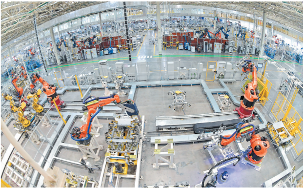
广汽埃安长沙智能生态工厂可年产20万辆新能源汽车。