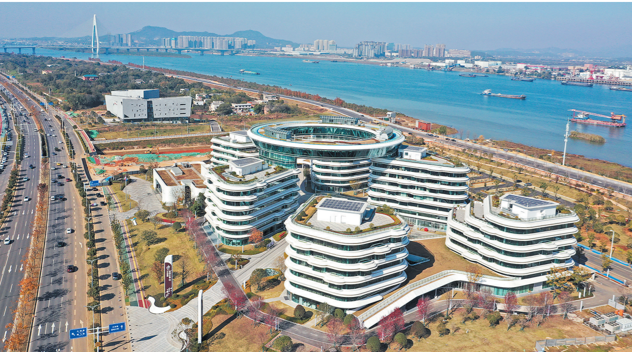
大泽湖片区等一批核心集聚区加速“生长”,为长沙能级跃升提供源源不断的动能。

创新生态持续完善,吸引“背着双肩包来创业”的年轻人纷至沓来,长沙人才黏性指数连续两年跻身全国前十,在中国城市创新能力百强榜居第9位,稳居国家创新型城市“第一方阵”。