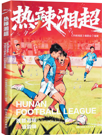
《热辣湘超》/《热辣湘超》编委会 编著/湖南人民出版社/2025年11月

随着赛程的推进，14个市州的队伍捉对厮杀，绿茵场上队员们你争我夺，互不相让，用默契的配合和精彩的球技，奉献了一场场酣畅淋漓的攻防对决。湘籍球员们在运动场上不遗余力地拼搏，生动展现了湖南人“霸得