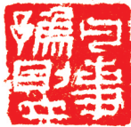
释义：凡事豫则立 篆刻/徐坦