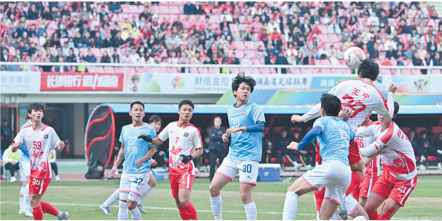
“湘超”成为融合体育、文化与城市发展的全民盛会。