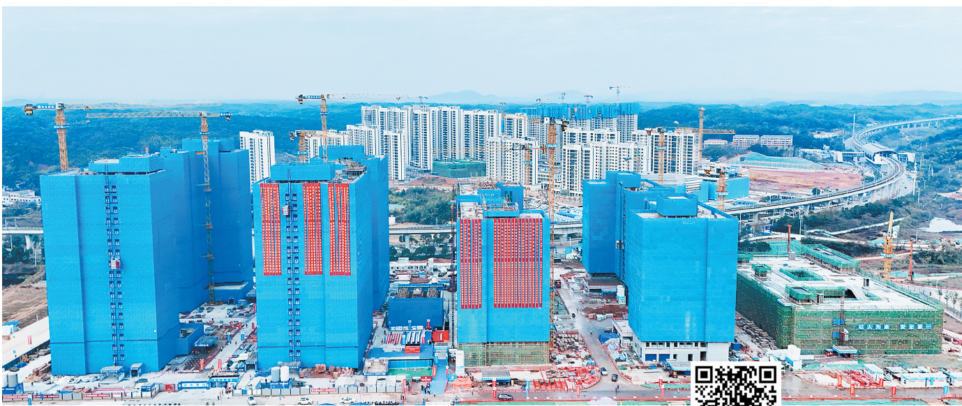
12月16日，湖南大学科创港校区建设项目三标段顺利完成主体封顶。