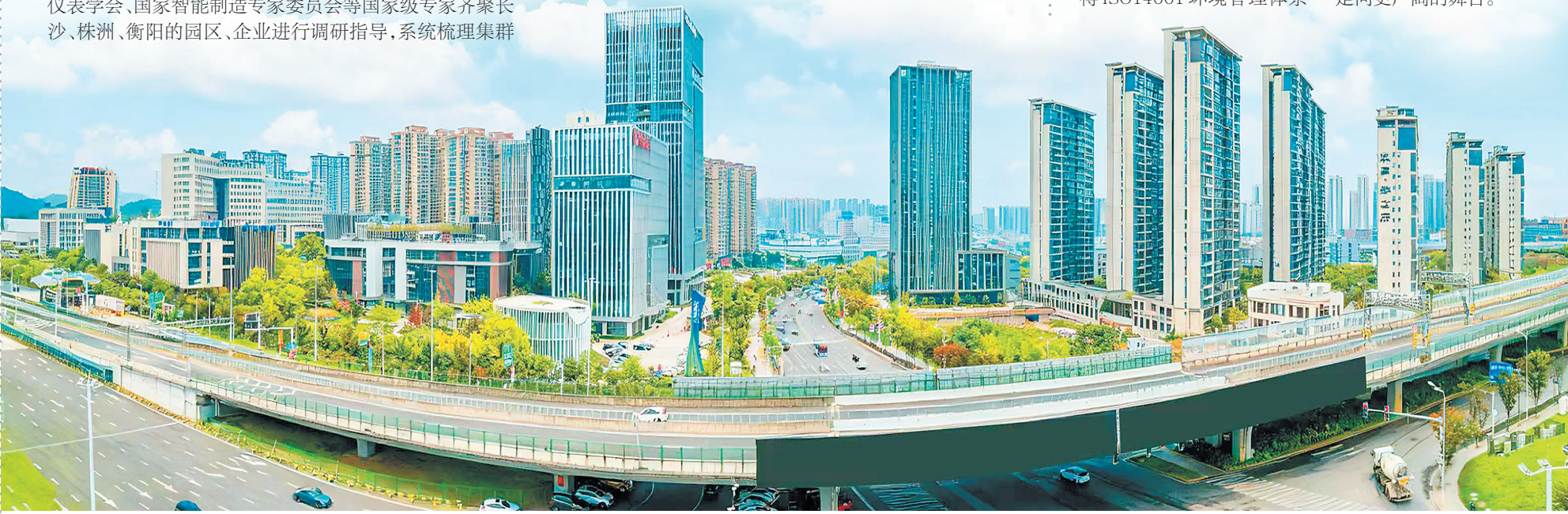
以岳麓高新区为主阵地的长沙市岳麓区检验检测仪器设备产业集群晋级“国家队”，图为岳麓高新区大景。