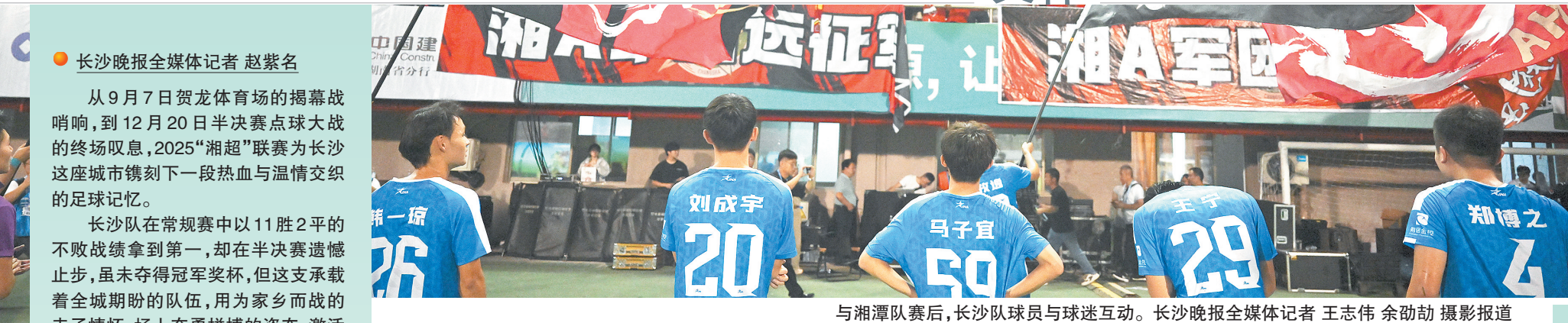
与湘潭队赛后,长沙队球员与球迷互动。