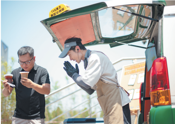
6月16日，长沙天气炎热。在给顾客制作完咖啡之后，他双手合十感恩顾客冒着炎热的等待。