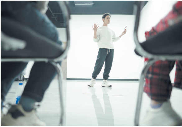
12月18日，他来到马栏山一家短剧公司试镜。他说一直没有放弃演员的机会，只要有机会他都会争取。