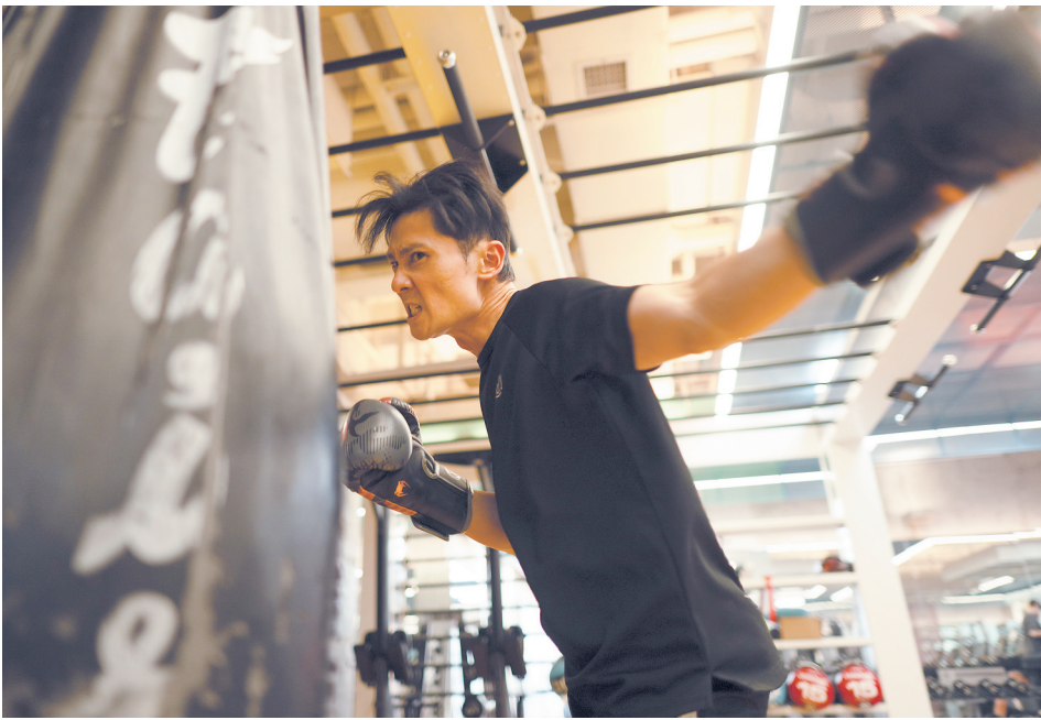
每周，他都给自己安排几次健身。他说这是47岁还能保持精力的秘诀。