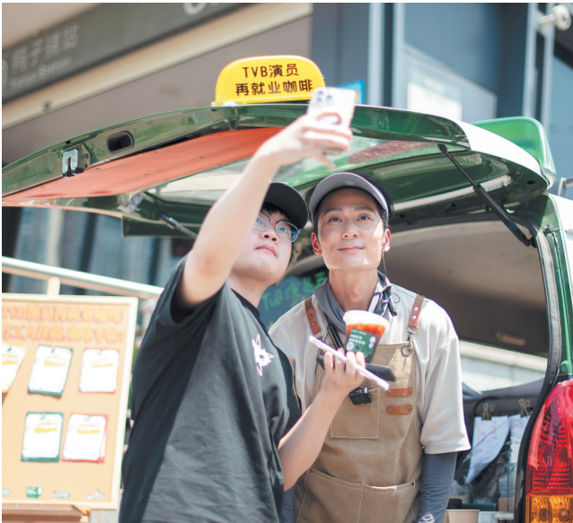
每做完一杯咖啡，只要粉丝有需求，他都会停下手中的活，和粉丝合影。