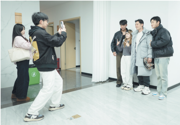
许多短剧演员也是姚亦澧的粉丝。