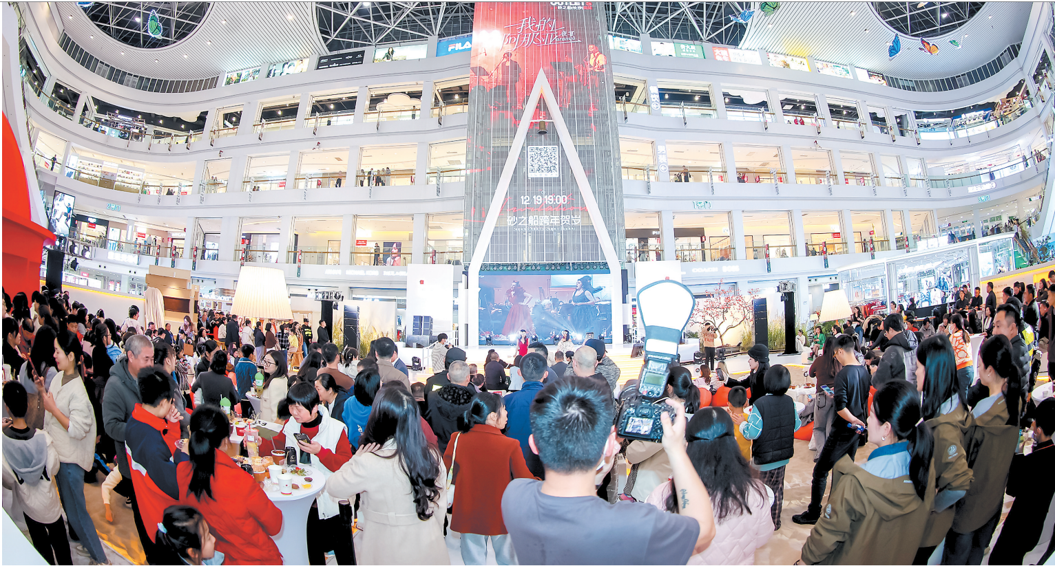
砂之船(长沙)奥莱的跨年活动已登场。