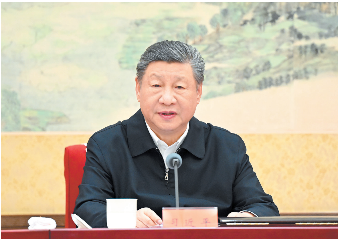
12月25日至26日,中共中央政治局召开民主生活会,中共中央总书记习近平主持会议并发表重要讲话。