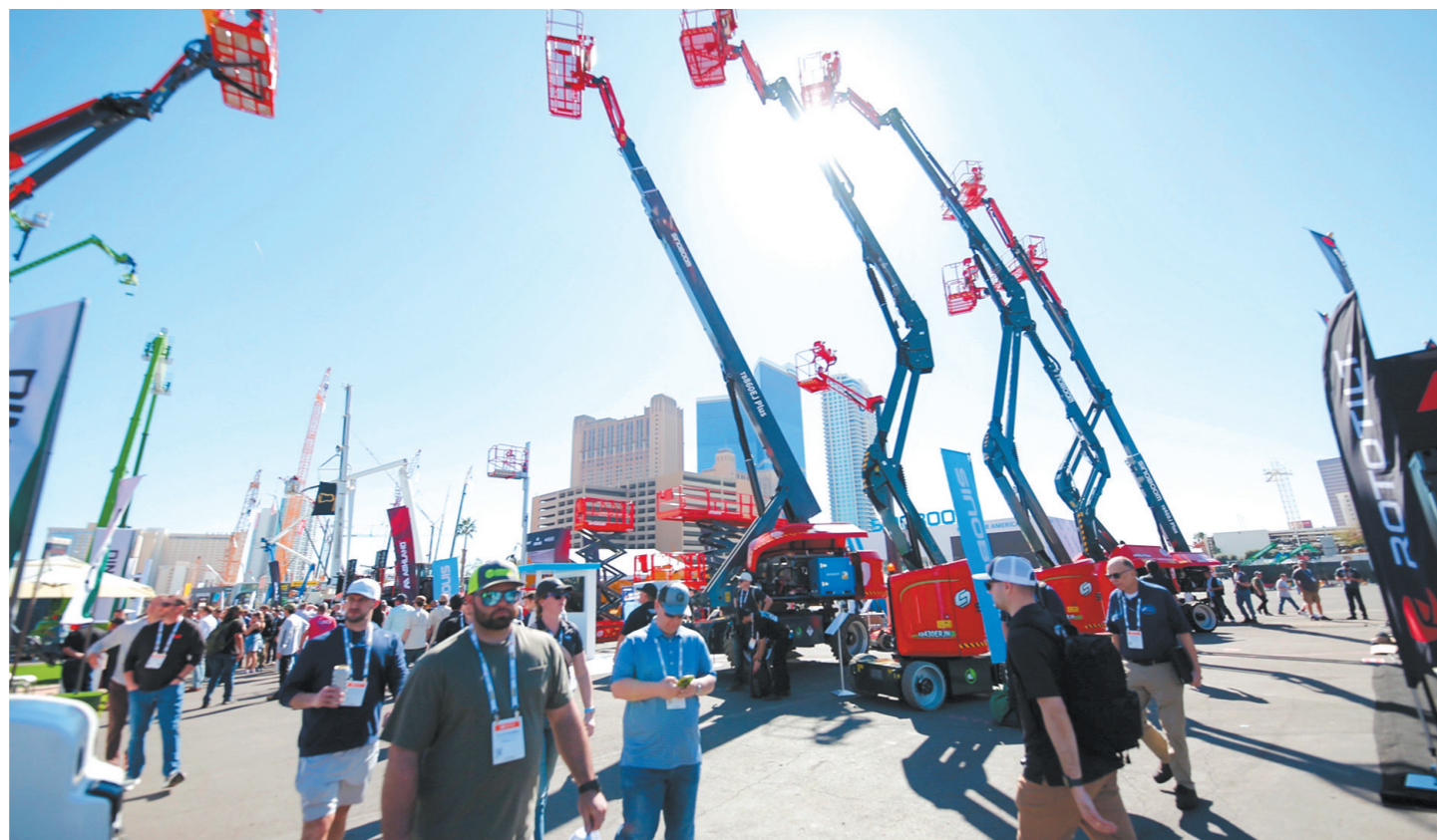
在本月上旬举行的2026美国拉斯维加斯工程机械展上，长沙工程机械收获满满。图为客商在星邦智能展位参观。

继星邦智能在波兰的首家海外生产基地投产，位于墨西哥的智造基地也正式投产。“美洲市场是星邦智能全球化战略的核心布局区域，我们已做好了全面深耕本地市