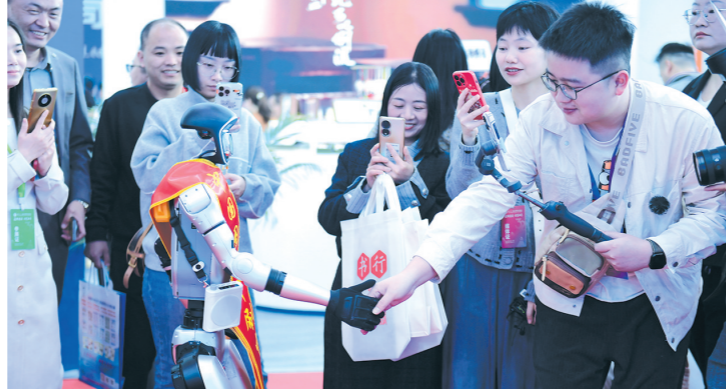
根植湖湘千年文脉,共创书香盛景

对读者而言,书会将通过主题论坛、名家讲座、新书首发等精心策划的活动,如春风化雨、润物无声,持续提升市民的阅读品位与人文素养;对出版行业而言,它不仅是“书香湖南”建设成果的集中展示窗口,更是洞察读者需求、探索内容创新与业态融合的前沿阵地,为行业发展注入源源不断的活力与灵感。