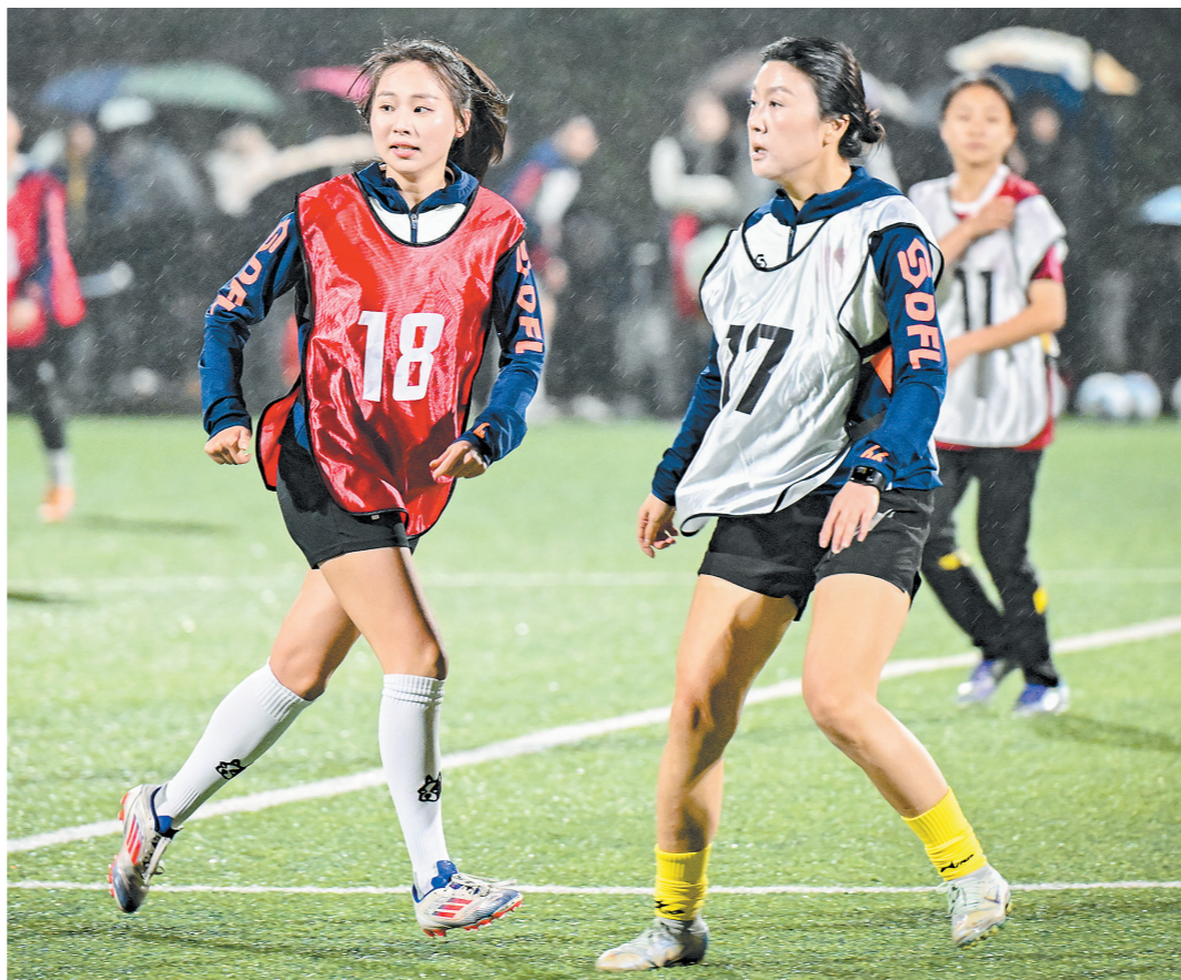
球员们雨中作战。3月23日晚,“湘女超”长沙队在南雅中学足球场进行了首次选拔测试。