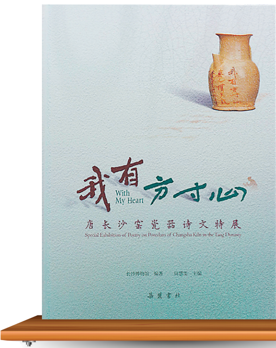
《我有方寸心》长沙博物馆 编著 周慧雯 主编/岳麓书社/2025年11月

为贯彻落实习近平文化思想和习近平总书记考察湖南重要讲话精神以及“一带一路”倡议,在国家文物局的领导下,长沙市、望城区两级政府高度重视海丝保护和联合申遗工作,在铜官窑海丝申遗遗址点的保护、利用、研究等方面做了一些工作,取得了一定成效。