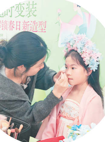
↑永旺梦乐城湘江新区店的春茶游园会上，小朋友体验春日新造型。