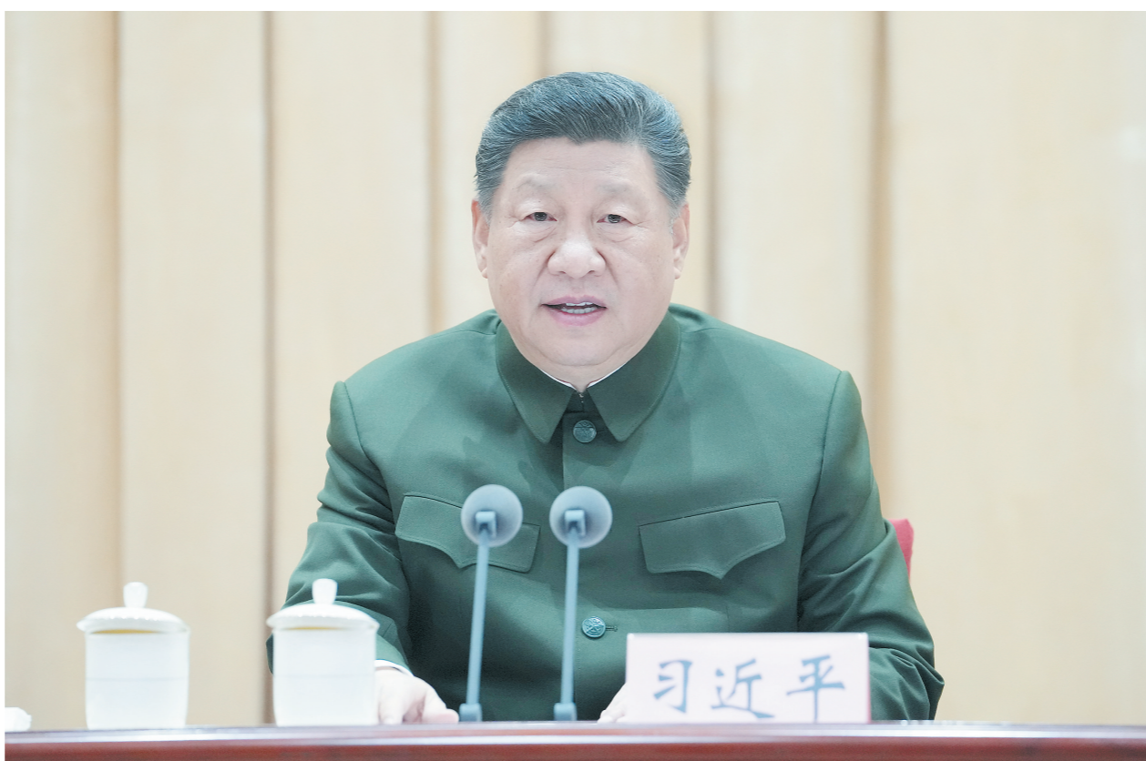
4月8日上午，全军高级干部培训班在国防大学开班。中共中央总书记、国家主席、中央军委主席习近平出席开班式并发表重要讲话。

中央军委副主席张升民主持开班式。第一期全军高级干部培训班学员，军委机关各部门、军队驻京有关单位主要负责同志等参加。开班式以电视电话会议形式组织，在全军相关军级以上单位分会场。