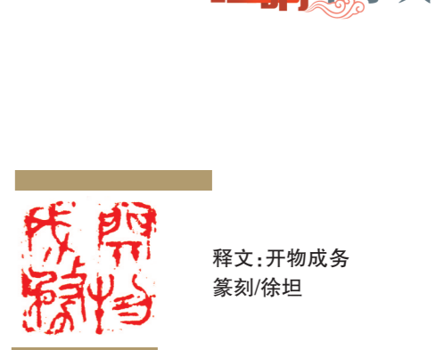
释文:开物成务 篆刻/徐坦

(作者系中共长沙市委党校教师,本文为湖南省社会科学成果评审委员会课题“乡村振兴背景下新乡贤赋能乡村治理的对策研究”(XSP25YBZ144)研究成果)