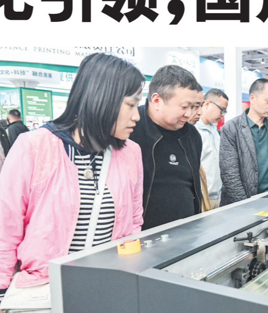
长沙印博会现场,科技感满满的印刷新设备吸引了众多目光。

服务和助力长沙“十五五”规划实施作为履职主线,深入开展“委员企业大走访、界别群众大调研”活动,紧盯持续优化营商环境、新材料产业链发展、乡村振兴等课题协商议政,高质量做好依法打击拒执犯罪、青少年心理防护等协商课题,用心办好民生类提案,持续推进改善生态环境专项民主监督。要以更高标准彰显委员担当和政协形象,进一步坚定政治立场,强化政治责任,严格廉洁自律。市政协要积极搭建协商议政舞台,畅通建言资政渠道,在助推长沙高质量发展和现代化建设中彰显政协担当、体现政协作为、贡献政协力量。