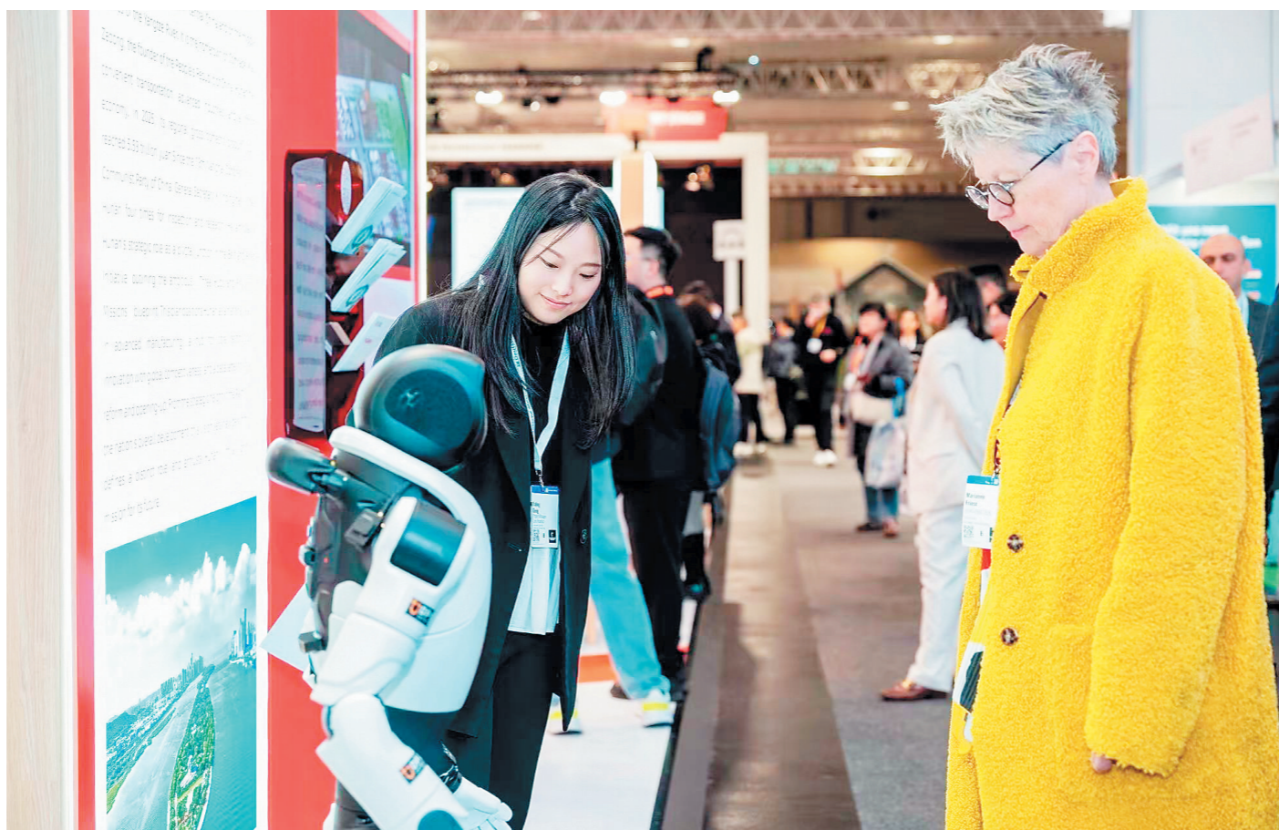
长沙经开区参展企业携最新技术成果与解决方案集中亮相，吸引了众多参展客商的目光。长沙晚报通讯员 黄训 供图

长沙晚报4月23日讯(全媒体记者 匡小娟 周辉霞 通讯员 黄训 李家宇)作为全球工业发展的“风向标”，被誉为“世界工业第一展”的2026年德国汉诺威工业博览会当地时间20日开幕。今年展会主题为“以技术洞见产业未来”，聚焦工业人工智能(AI)、机器人技术等前沿领域。借助湖南